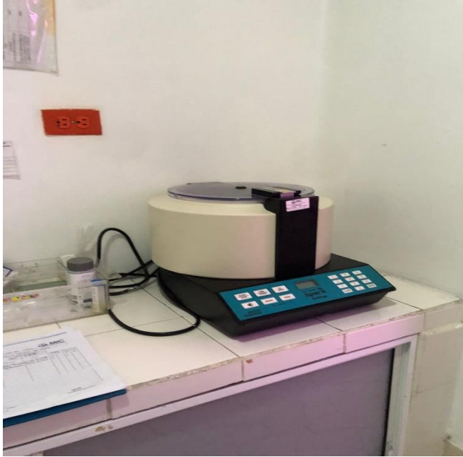
Figura 4. Servicio de calibración en Laboratorio clínico General del Norte.