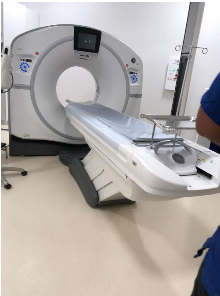
Figura 5. Servicio mantenimiento en clínica Serena del Mar