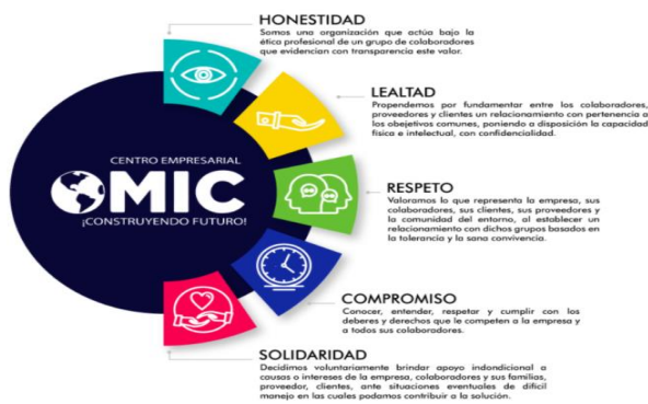
Figura 2 Valores Corporativos MIC Metrología (MIC Metrología, 2021)

Los valores corporativos de MIC S.A.S los podemos resumir en la siguiente imagen