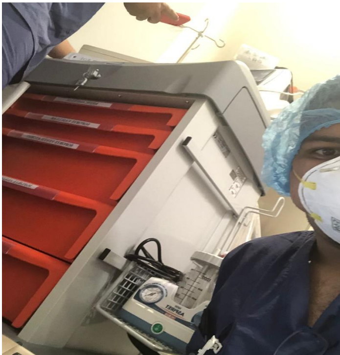
Figura 3. Servicio en clínica Serena del mar Cartagena (noviembre,2021).