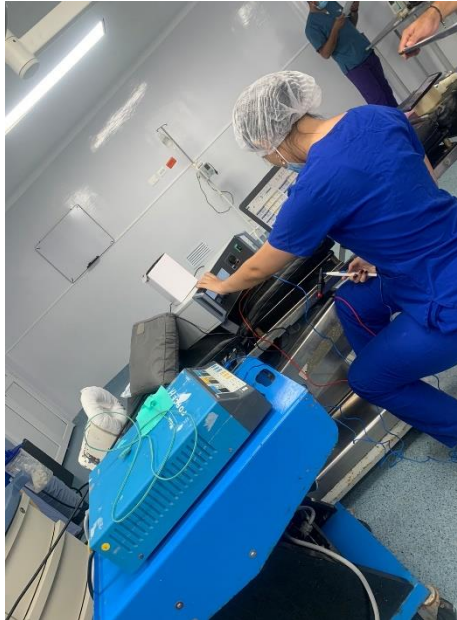
Figura 2. Calibración de unidad electro quirúrgica.