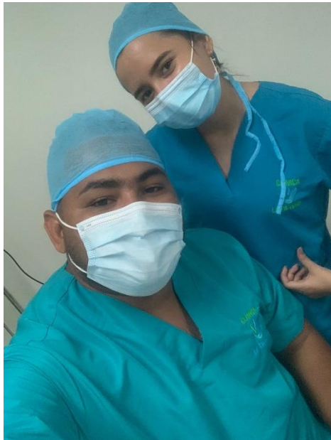
Figura 4. Servicio de calibración Clínica La Victoria.