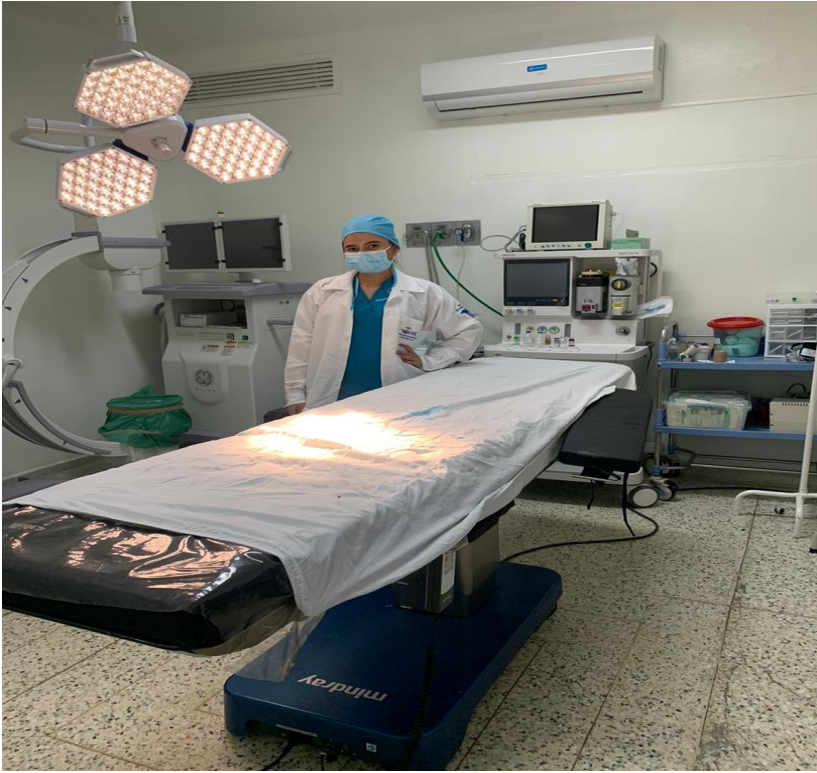
Figura 1. Calibración maquina de anestesia.