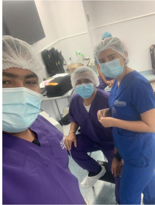
Figura 3. Servicio de calibración de bombas de infusión.