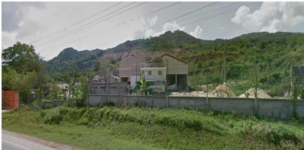
Figura. 2. Vista de la zona de fabricación de carbonato de calcio.

La organización se enfoca en cumplir las necesidades y expectativas de los consumidores con productos de óptima calidad, cuenta con procesos y equipos adecuados para la transformación de la materia prima, después de realizados dicho proceso es empacado en bolsas de aproximadamente 40 kilogramos para su posterior comercialización, con precios justos contando para ello con el personal competente, tecnología e infraestructura adecuadas.