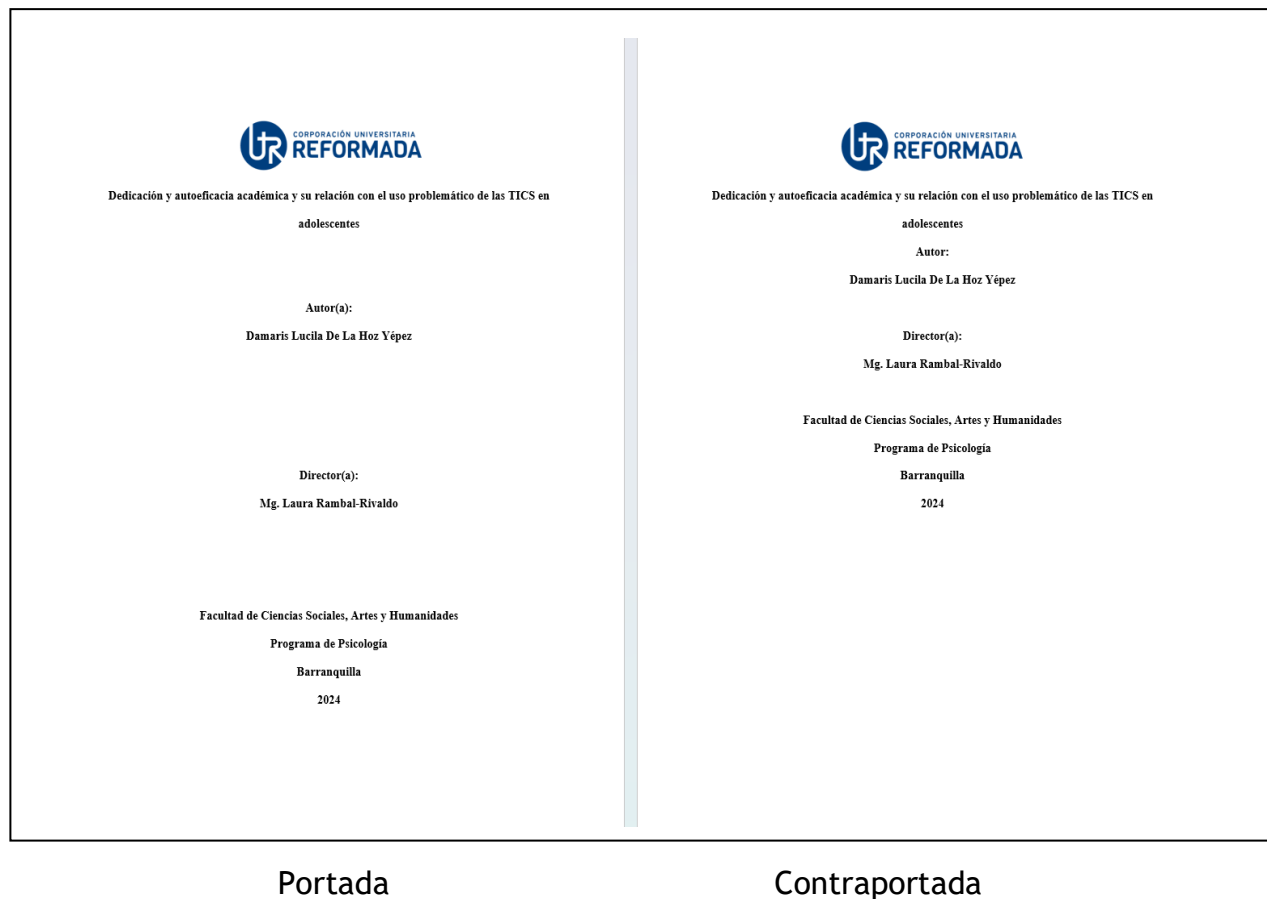
Figura 2. Ejemplo de la portada y contraportada de un trabajo de investigación.

Los trabajos llevarán portada y contraportada con el formato dispuesto en la Figura 2.