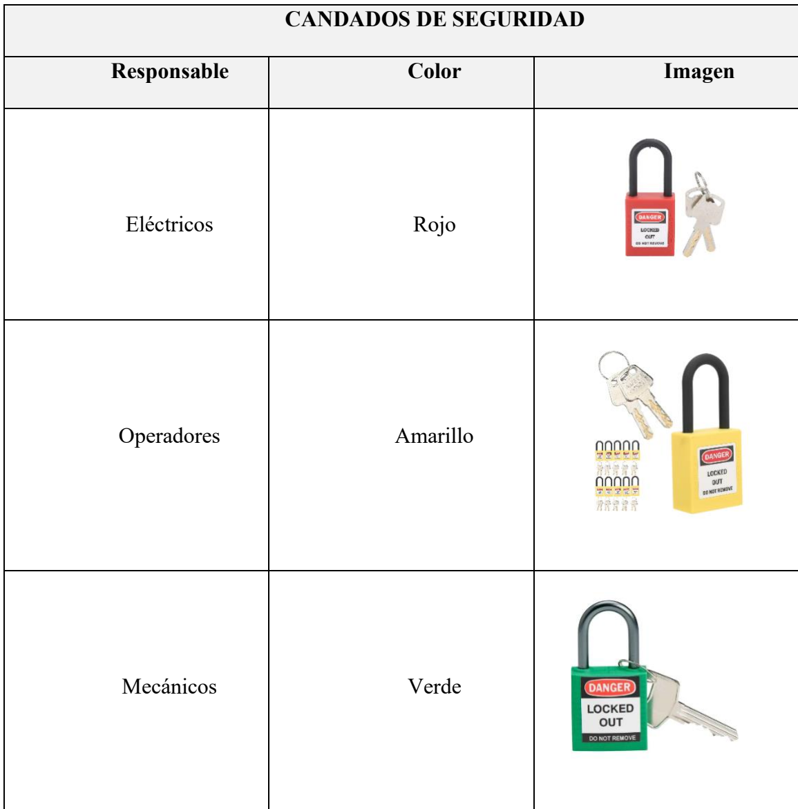
1. TABLA CANDADOS DE BLOQUEO

10.7 Candado de Seguridad: son elementos mediante los cuales se realiza el bloqueo o aislamiento a una máquina, son colocados en los puntos principales de los dispositivos de bloqueo. (Tovar, 2014) Los cuales se identifican en la siguiente tabla