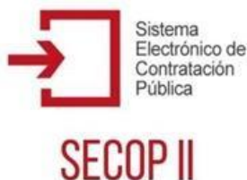
Figura 4: Logo de SECOPII