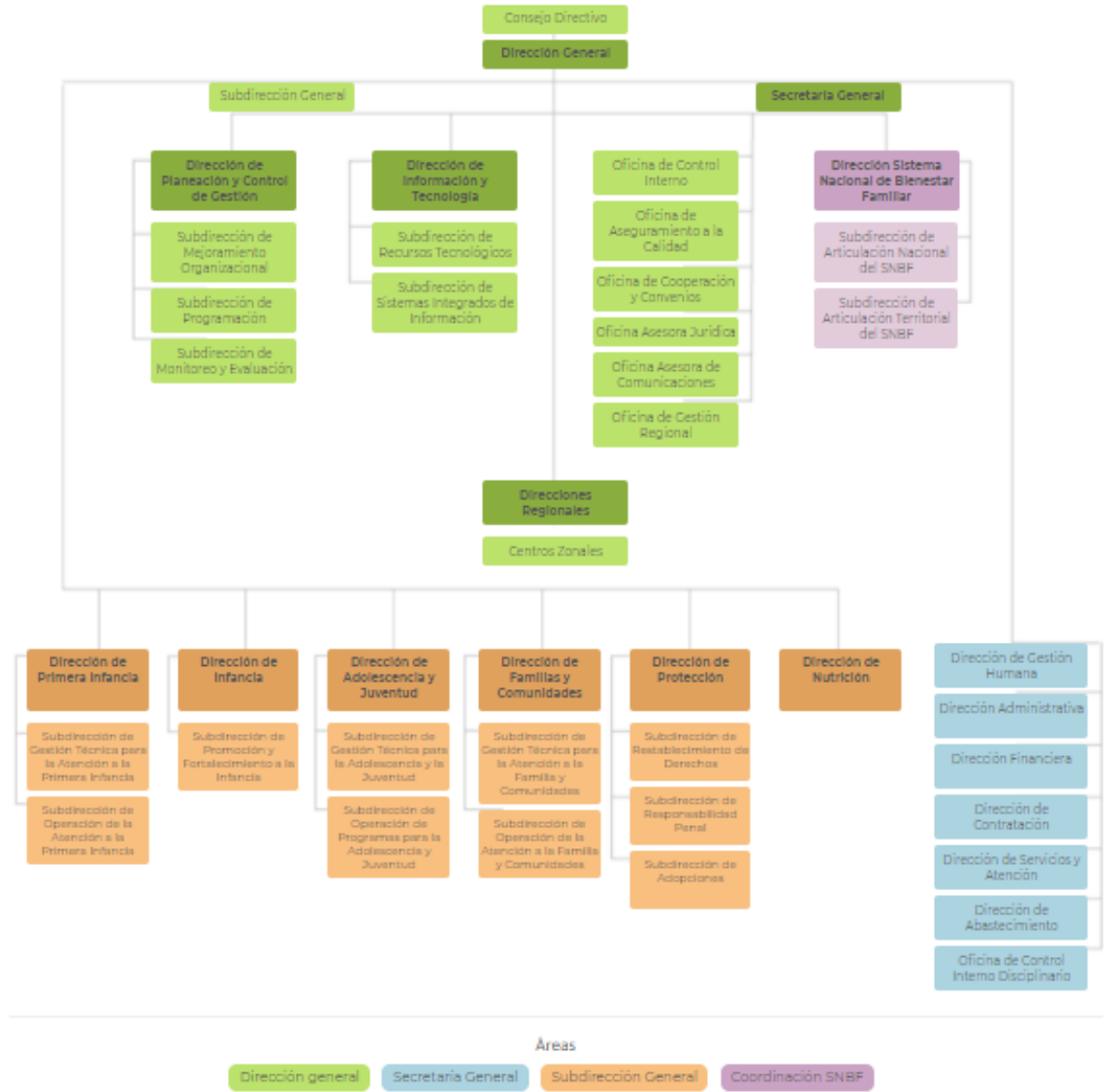
Figura 3: Estructura Orgánica ICBF