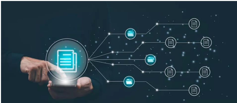
Imagen sitio web obtenido por Smart contract, (ISDI, 2023), www.isdi.education/es

Los Smart Contracts, o contratos inteligentes en español, son programas informáticos autónomos diseñados para ejecutar automáticamente, verificar o hacer cumplir los términos de un acuerdo cuando se cumplen ciertas condiciones preestablecidas. Estos contratos están basados en tecnología blockchain y utilizan códigos informáticos para automatizar y facilitar el proceso de transacción sin necesidad de intermediarios. Al ejecutarse en una red blockchain, los smart contracts son inmutables y seguros, lo que significa que una vez que se establecen las condiciones y se activan, no se pueden modificar ni manipular. Esta característica los hace ideales para una variedad de aplicaciones, desde transacciones financieras hasta acuerdos legales, garantizando la transparencia y la confiabilidad en las interacciones digitales.(Dapp Application, 2019)