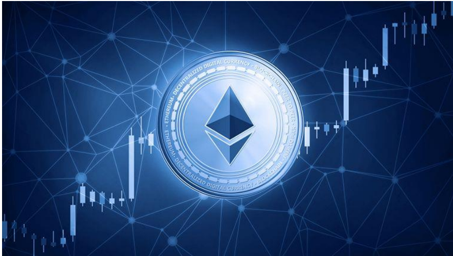
Imagen sitio web obtenido de Ethereum, (Tragget, 2022), https://libertex.org/es/