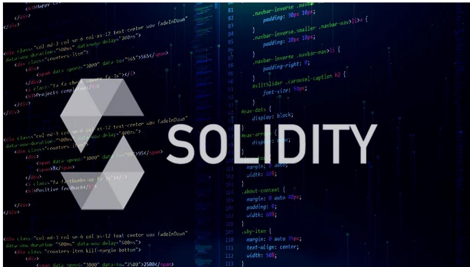
Imagen sitio web obtenido de Solidity, (Cuero, 2023), https://es.linkedin.com/

No se encuentran elementos de tabla de ilustraciones.