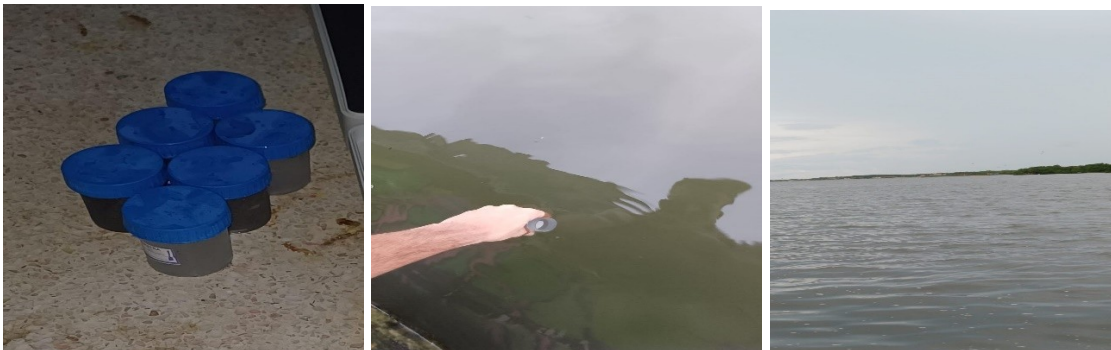
Figura 2. Toma de muestra simple

En esta investigación, para la captación de las muestras de agua para la evaluación de los parámetros, se realizaron dos pasos la primera fue utilizar un recipiente estelarizado y adaptando una captación simple de este acuífero, para posterior ser conservado en una nevera refrigerada. Como segundo paso fue trasladado a un laboratorio para posteriormente realizarse unos estudios donde se evidenciaron el ph, conductividad, tds, temperatura y resistencia.