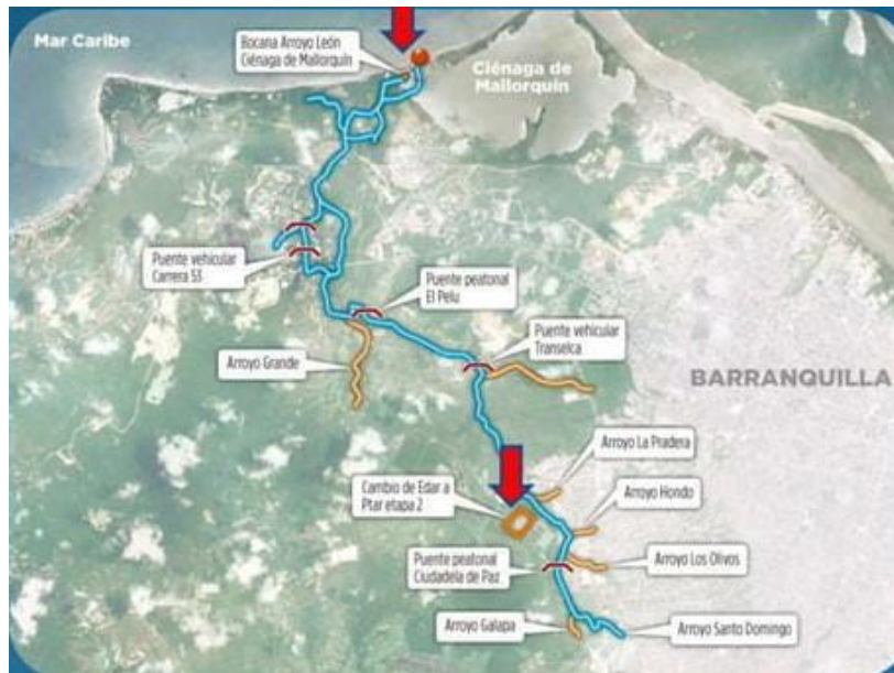
Figura 3. recorrido del arroyo león y sus afluentes