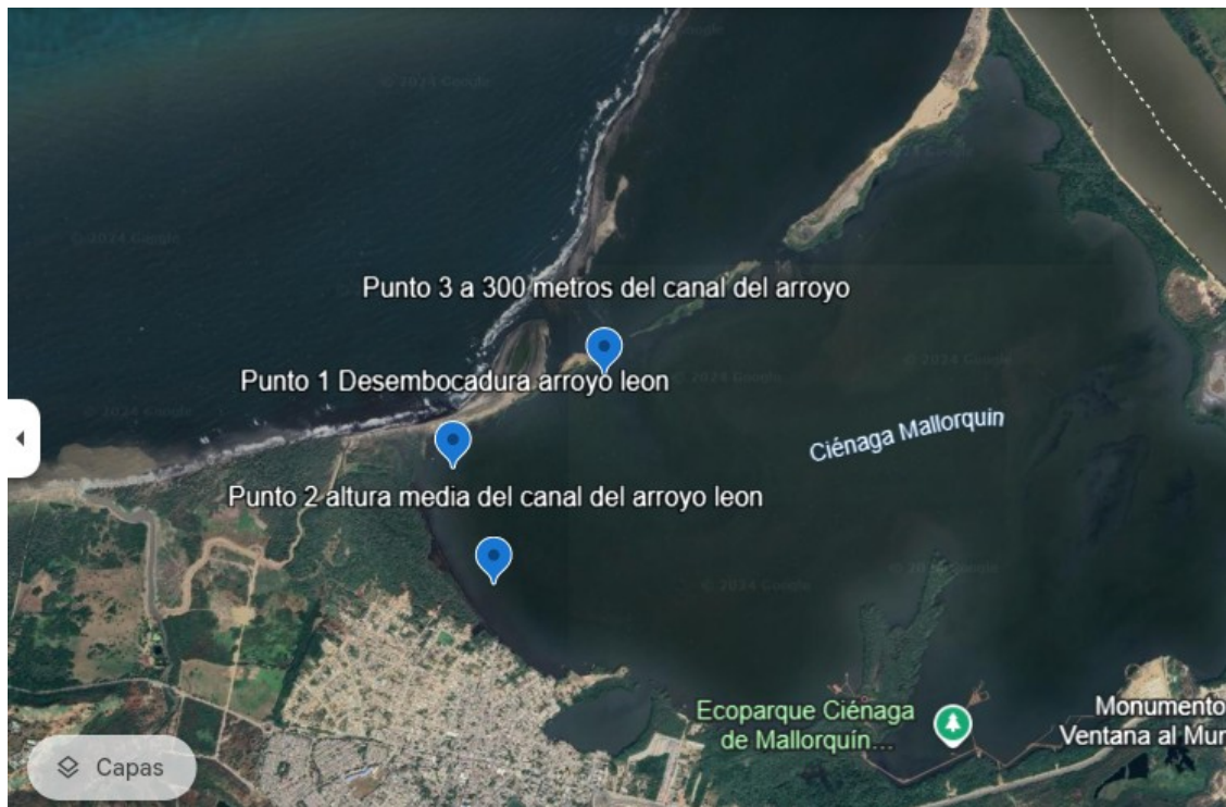
Figura 4. Ubicación de la selección de puntos de monitoreo en la ciénega de mallorquín